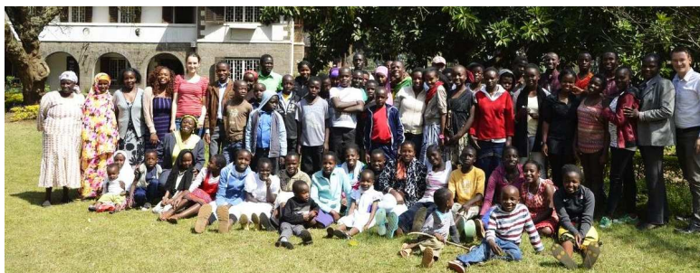
Treffen einiger RealStars Kinder