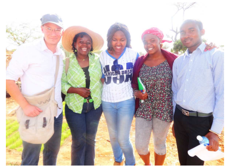
Teil des RealStars-Teams bei einem Seminar im Hochland Kenias