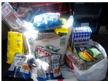
Essensrationen sind notwendig, wenn Kinder nicht ausreichend ernährt werden.

Es bleibt unser erstes Ziel, bedürftigen Kindern eine Schulbildung zu ermöglichen. Aber bekanntlich studiert sich mit leerem Magen schlecht. Daher versorgen wir besonders arme Kinder aus unserem Programm mit Essensrationen.