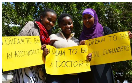
Diese Kinder können träumen, weil ein Pate ihre Schulbildung ermöglicht.

Welche Träume haben Kinder, die in einem Slum aufwachsen? Die Berufswünsche zumindest unterscheiden sich nicht besonders von Kindern irgendwo sonst in der Welt: Lehrer, Arzt,