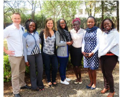
Das RealStars Team

In den letzten Monaten ist bei uns hier bei Real Stars so viel passiert, dass es nicht auf zwei Seiten passt – daher hat dieser Newsletter jetzt eine dritte Seite. Wir wollen euch allen danken für die andauernde Unterstützung und Liebe für unsere Kinder. Ohne euch wären sie nicht dort, wo sie heute sind. Ihr habt ihre Leben für immer verändert. Gott möge euch für eure Großzügigkeit segnen.