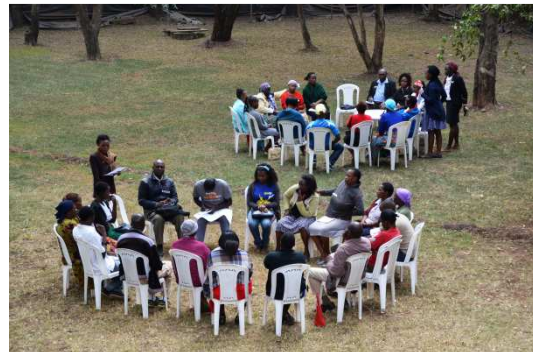
Workshops im Garten über "Marketing für kleine Unternehmen" oder "Ausbau deines Geschäftes"