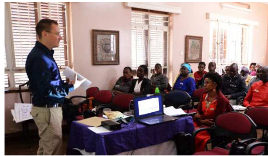
Unser Business Forum deckte Themen ab wie "Du als deine eigene Marke" oder "Unternehmen nach Gottes Willen"