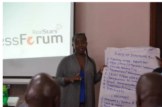
Präsentation der Workshops im Plenum