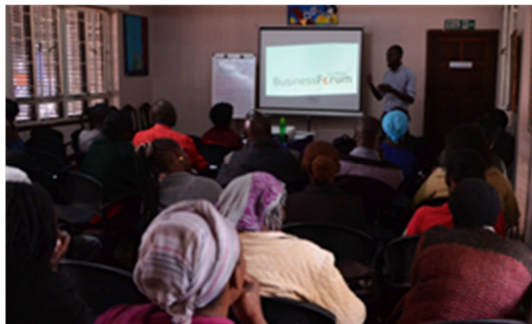
RealStars Business Forum

Im Laufe der letzten 3,5 Jahre haben insgesamt 222 Unternehmer erfolgreich unser Business Seminar durchlaufen. Somit wurde es höchste Zeit, sie wieder alle zusammen zu bringen.