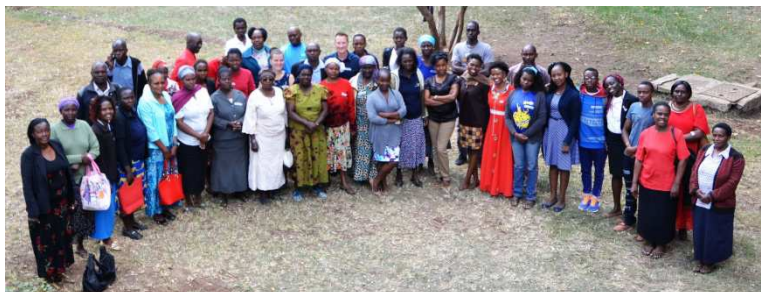
Business Forum Gruppenfoto